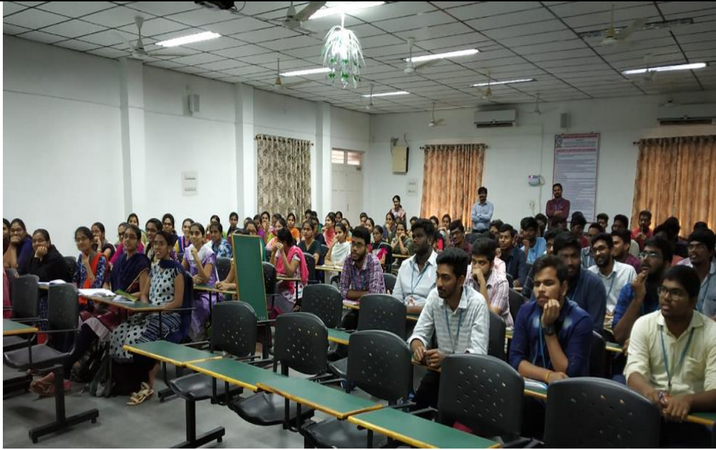
Student Participants in A Two Day Workshop on “Microsoft Cloud Technologies” Jointly organized by NEcX Private Limited during 15 th and 16 th March, 2019 for Students