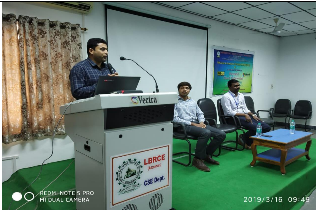
Gathering of Dignitaries on the dais for the Inaugural Ceremony of “Microsoft Cloud Technologies” workshop.