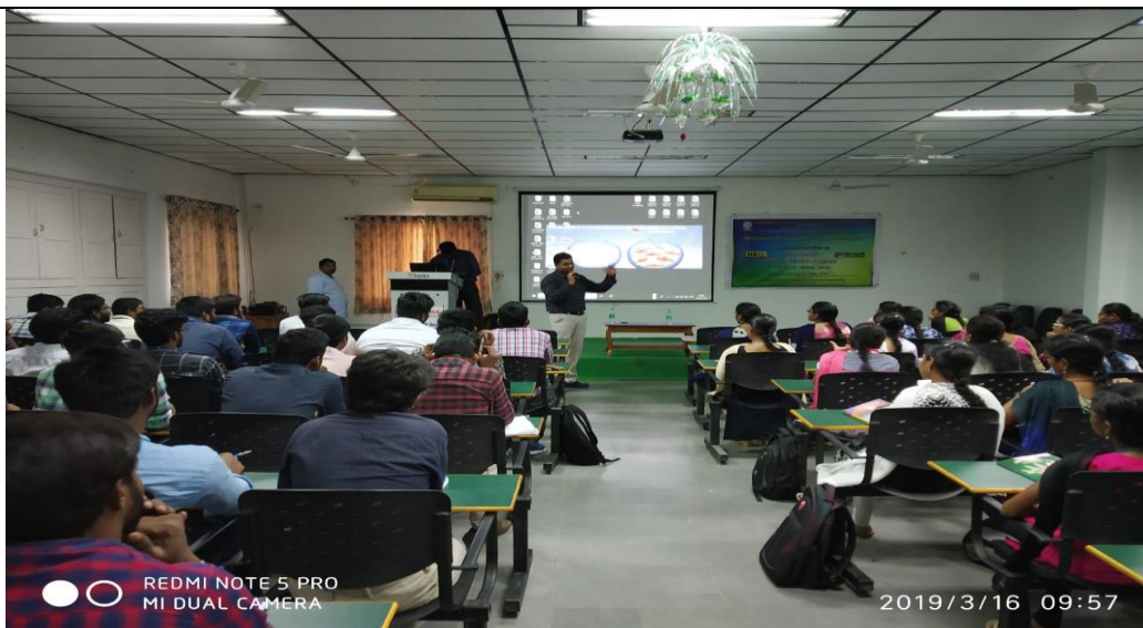
Resource Person(s) addressing the student gathering about “Microsoft Cloud Technologies”